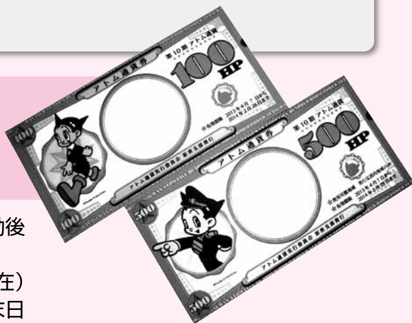
100馬力と500馬力のアトム通貨券（見本）

市内のアトム通貨加盟店（181店舗：平成25年8月末現在）で使用できます。使用できる期間は、4月7日から翌年2月末日までとなりますのでご注意ください。