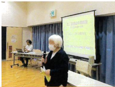
中森会長のあいさつ↑

新座ふれあいの家にて実施した中間報告会は、オープニングアクトとして「遊びの広場ガチャガチャバンド」の皆さんの演奏から楽しく始まりました。