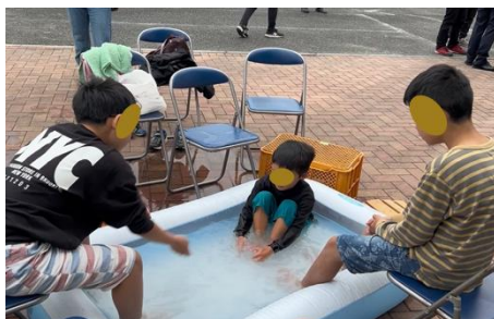
ドラム缶と炭で沸かした足湯