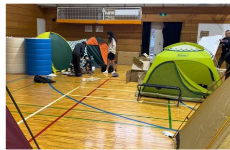
体育館に簡易テントを張って