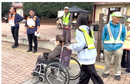
高齢の方を車いすで出迎え